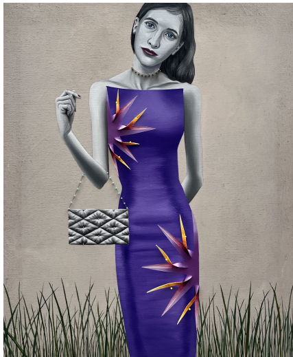
“There ain't no Sunshine” (2024) 65 x 54 cm

La mostra es podrà visitar del 19 de setembre al 9 de novembre.