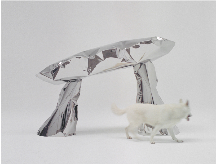
Dolmen_04, 2022, acero inoxidable, 270 cm.

La estructura se suspende desde un falso techo tensado iluminado con luces led que se ha podido ejecutar mediante Barrisol y la empresa Instalación de Materiales Acústicos y Decorativos (IMAD) .