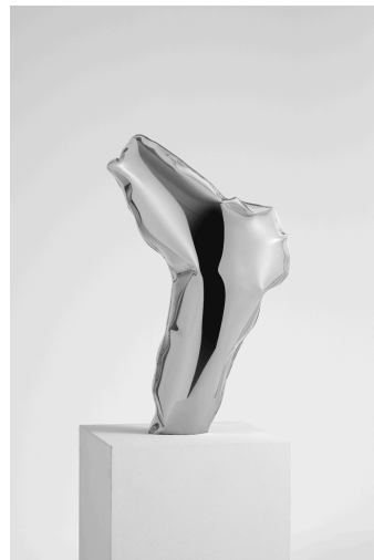
Estela_03 , 2021, acero inoxidable, 60 cm.