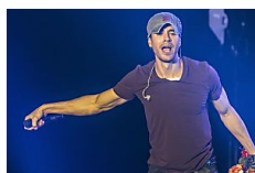
Enrique Iglesias vuelve a liarse con un 'playback'