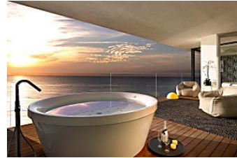
Los hoteles más sexy de España: habitaciones con jacuzzi privado Room5