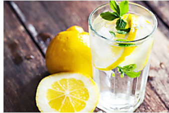
Esto es Lo Que Pasa Cuando Bebés Agua Con Limón noticiariodirecto.com