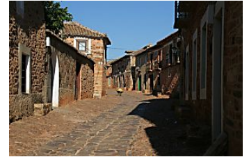
Los diez pueblos más bonitos de España Simpatia.es