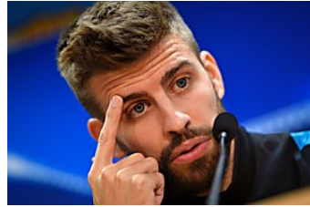
El tremendo elogio de Gerard Piqué a Leo Messi