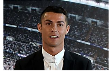
Recital ególatra de Cristiano Ronaldo