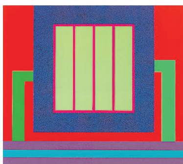
Obras de Peter Halley en la exposición