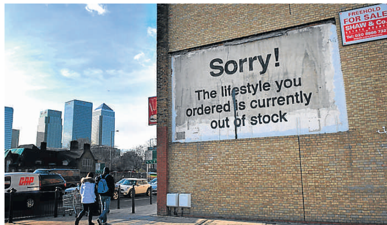
Graffiti de Banksy en Londres el pasado diciembre

Pero la mayor conjunción arte-moda-música-poesía está en la cultura hip hop. El rap de Tupac y de Eminem. El graffiti del metro de Nueva York, las intervenciones poéticas en los muros, de Banksy. La pintura de Basquiat. El break dance, MC5. Y una juventud marginal que no se conforma. Podríamos seguir. La creación en todas sus disciplinas, aunque sus asociaciones sean remotas, siempre tienen un nexo común y vertebrador: la voluntad del hombre para comunicarse. Y para conversar con el propio hombre. |